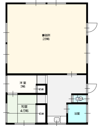
※現調寸法は、地籍測量図をもとに作成