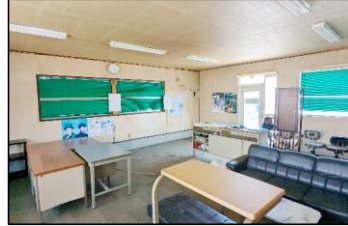
内部の家具類撤去・設備補修を行います