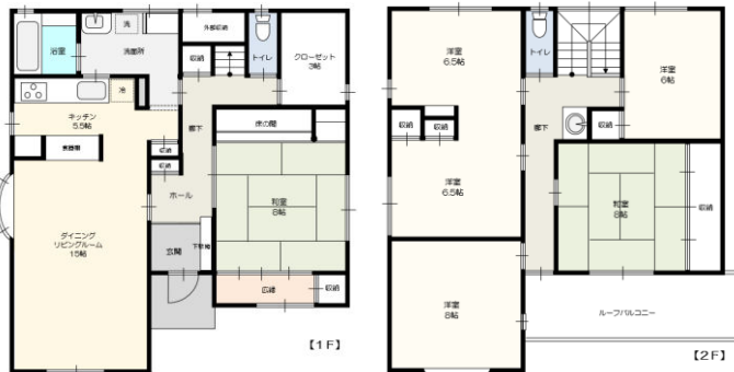
※図面と相違する場合は、現況を優先します。