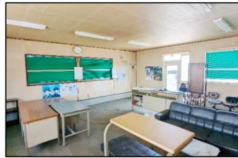
内部の家具類撤去・設備補修を行います